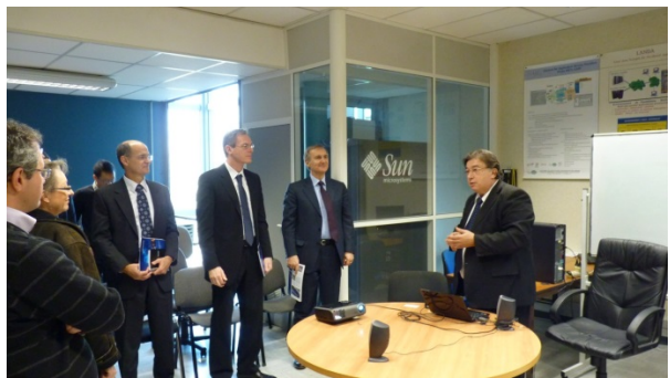
Photos lors de la présentation des logiciels NEST de QoS Design au LAAS-CNRS